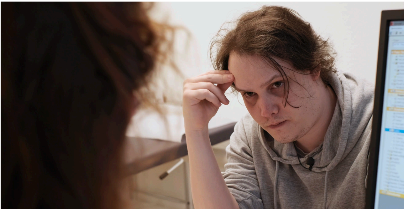
Szene zum Thema Aggression von Patienten gegenüber Gesundheitspersonal

Videoszenen sind ein ideales Medium, um Geschichten zu erzählen: Die Zuschauenden identifizieren sich mit überzeugenden und authentisch gespielten Szenen, die so zum Erlebnis werden. Dadurch beteiligen sie sich nicht nur kognitiv sondern auch emotional an den Lernprozessen, mit denen sie im Rahmen von Schulungen, Workshops, Weiterbildungen, Trainings oder Prüfungen konfrontiert sind.