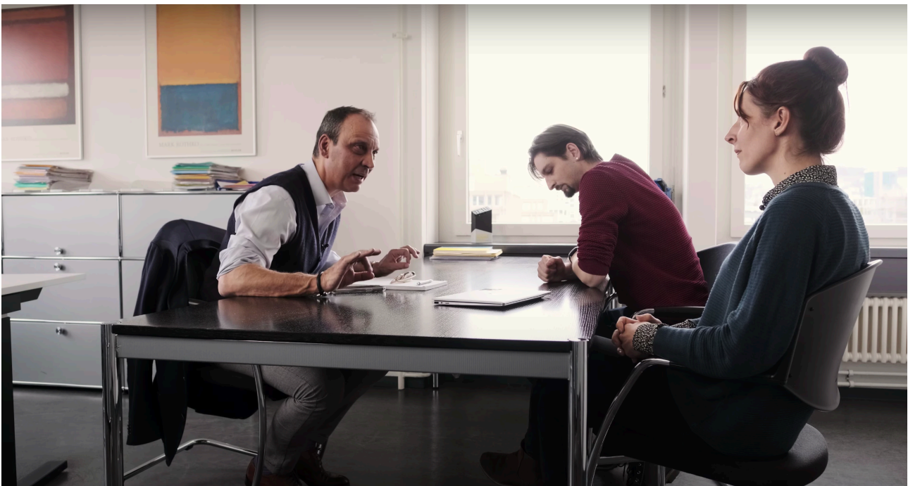
Szene zum Thema Achtsame Führung

Das Ziel von EduScene ist es langfristig, eine Plattform zu bilden. Darauf werden interessierte Institutionen und Unternehmen aus einem ständig wachsenden Angebot an Videoszenen auslesen und sie durch den Erwerb der entsprechenden Lizenzen für ihre Zwecke in der Bildung oder im Betrieb einsetzen können. Die Plattform soll eine breite Palette von Themen bereithalten aus den Bereichen (Erwachsenen-)Bildung, Human Resources, berufliche Aus- und Weiterbildungen. Durch die einmalige Produktion zu einem bestimmten Thema und die spätere Distribution auf der Plattform können Synergien zwischen den Abnehmer*innen genutzt und Videoszenen ressourcenschonend zugänglich gemacht werden: Der Produktionsaufwand mittels Lizenzvergaben wird auf mehrere Schultern verteilt.